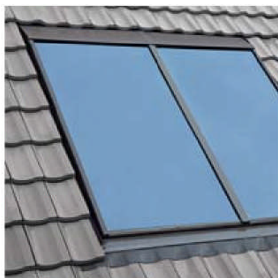
Installation solaire thermique (surface brute 4,26 m 2 ) pour les besoins d'une famille en production solaire de l'eau chaude sanitaire.

Du projet jusqu'à la mise en service. Du toit à la cave. Car, Roto vous livre la solution complète. Capteurs thermiques, éléments photovoltaïques, raccords d'étanchéité, fenêtres de toit, technique de régulation et éléments de stockage compris. Ces systèmes sont éligibles aux crédits d'impôts et autres subventions régionales.