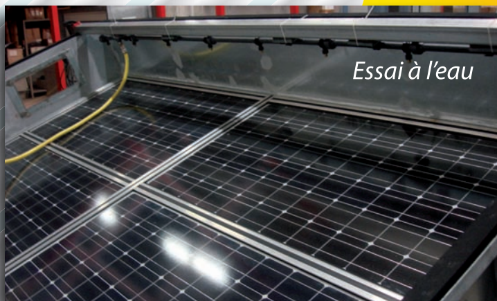
Essai à l'eau