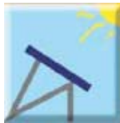
Schéma d'une structure de type console non éligible à la prime d'intégration au bâti

Les toitures, ardoises ou tuiles installées en surimposition à une structure ne sont pas éligibles. Ainsi, l'installation d'un panneau monté sur un toit terrasse sur une structure métallique, dite de « type console », ne peut être considérée comme de l'intégration au bâti.